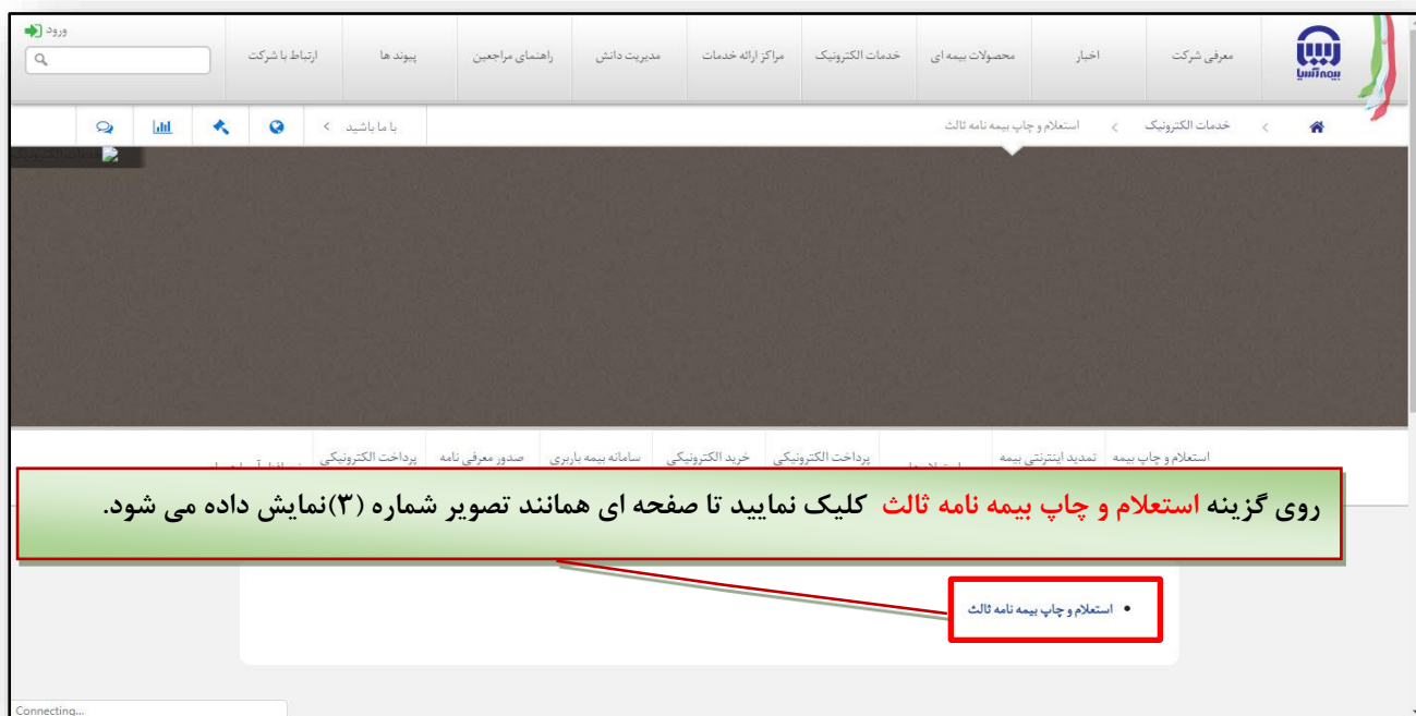
شکل شماره (۲)

۱) بر روی لینک «استعلام و چاپ بیمه نامه ثالث» کلیک نمایید.